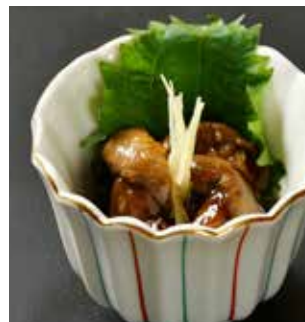
肝煮 Boiled Eel Liver 煮鰻魚肝