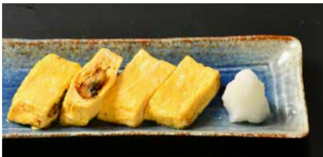
う巻き Eel Omelet 鰻魚煎蛋卷