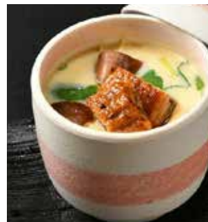
うなぎ入り茶碗蒸し Eel Steamed Egg Custard 鰻魚蒸蛋羹