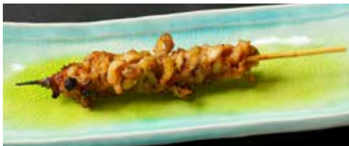
バラ身(あばら軟骨) Eel Rib cartilage 鳗鱼肋软骨 850