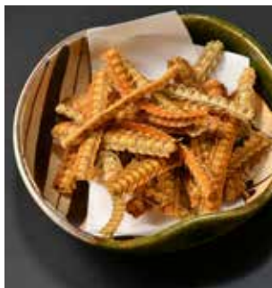
骨せんべい Deep fried Eel Bones 油炸鰻魚骨