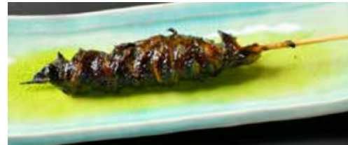
ヒレ巻き Eel Fin 鳗鱼翅 850