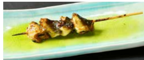
エリ焼き(兜) 生姜・にんにく風味 Eel Head 鳗鱼头 750