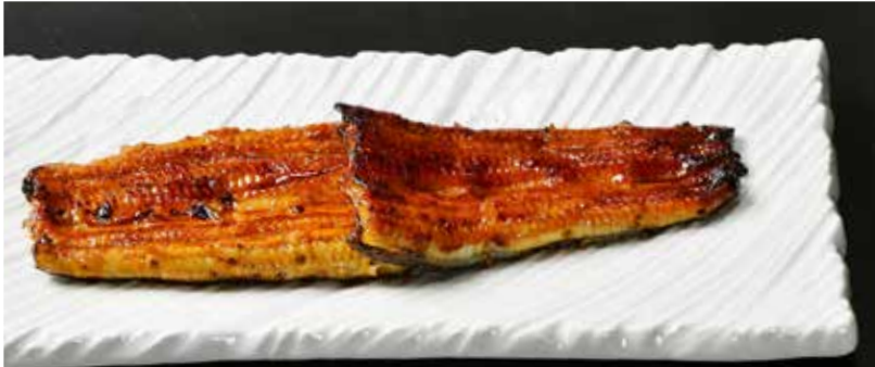
うなぎ一尾 Regular 一条