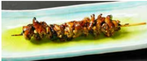
肝焼き Eel Internal Organs 鳗鱼内脏 750