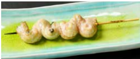
くりから(うなぎ巻き) わさび醤油 Eel Roll with Wasabi 鳗鱼卷 900