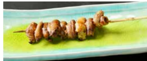
【数量限定】レバー Eel Liver 鳗鱼肝 800