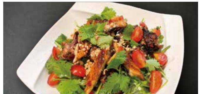
うなぎのパクチーサラダ タイ風ドレッシング Eel Coriander Salad with Thai style dressing 鰻魚香菜沙拉配泰式醬